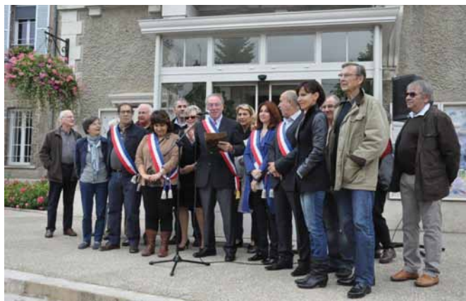
Le conseil devant la mairie le 19 septembre.

La Municipalité de Bourron-Marlotte s'est associée à l'appel lancé par l'Association des Maires de France (AMF) pour se mobiliser dans toute la France le 19 septembre contre la forte baisse des dotations de l'Etat accordées aux communes et intercommunalités.