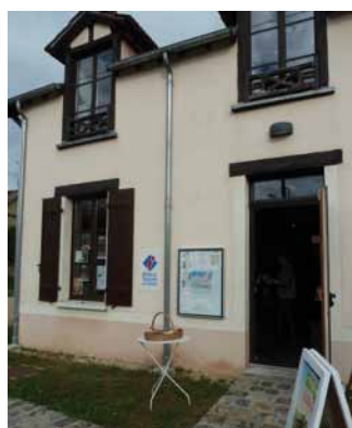
Office de tourisme 01 64 45 88 86 bourronmarlotte@fontainebleau-tourisme.com

Dans sa séance du 11 septembre dernier, le Conseil municipal a voté à l'unanimité le dépôt de la candidature de notre village au label « Village de Caractère ».