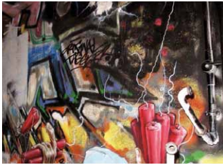
Printemps des poètes