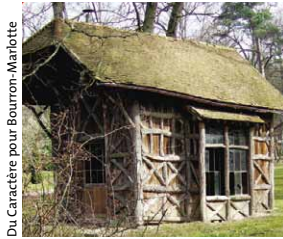
Du Caractère pour Bourron-Marlotte

永和九年歲在癸丑暮春之初 于會稽山陰之蘭亭脩禊事 也羣賢畢至少長咸集此地 有峻嶺茂林脩竹又有清流激湍 映帶左右引以為流觴曲水 列坐其次雖無絲竹管絃之盛 一觴一詠亦足以暢敘幽情 是日也天朗氣清惠風和暢仰 觀宇宙之大俯察品類之盛