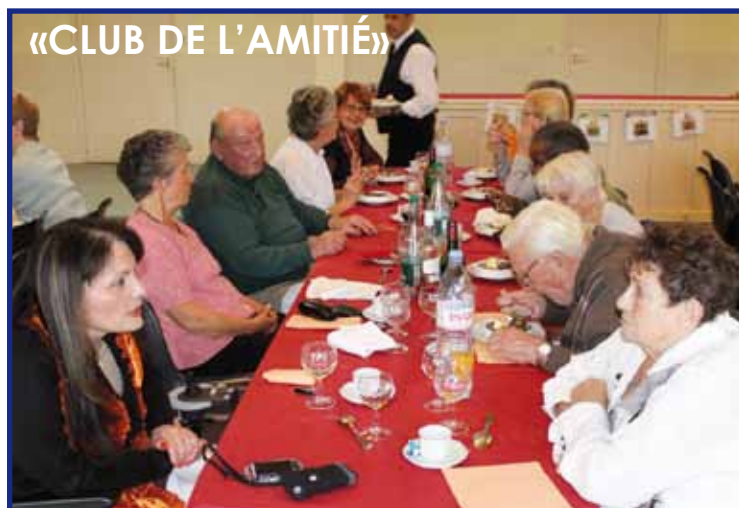
Repas / Concours du mercredi 17 oct. 2012

De toute façons, chacun est reparti avec un petit cadeau après avoir passé de bons moments alliant convivialité et gaieté !