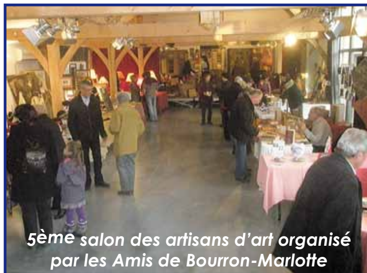
5ème salon des artisans d'art organisé par les Amis de Bourron-Marlotte

et de la créatrice de bijoux en verre de Murano... verre fabriqué avec le sable de Bourron-Marlotte, rendez-vous sur la page des Amis de Bourron-Marlotte :